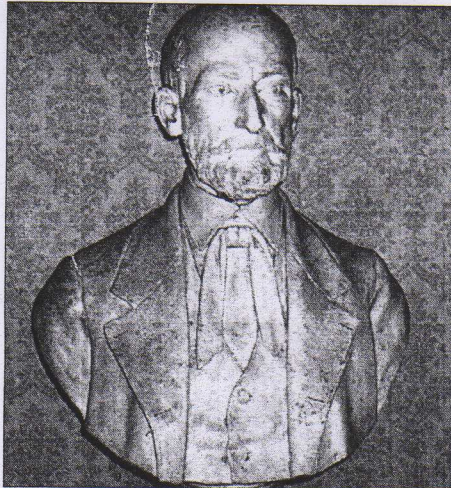
Il busto di Donato Morelli; in basso: un bassorilievo che raffigura la stretta di mano tra Morelli e Garibaldi

Entrati nel Comitato rivoluzionario antiborboni-